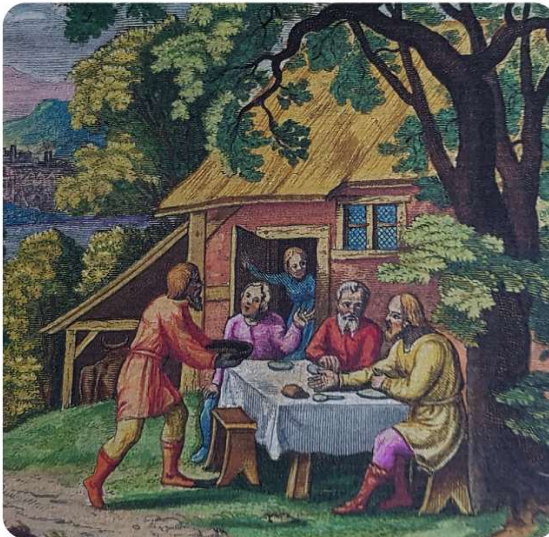
Matthäus Merian der Ältere

Engel, durch die Gott zu Abraham spricht? Entsteht im Gegensatz zur unmittelbaren Gottesbegegnung, die wir im Paradies vor dem Sündenfall zwischen Adam und Eva und Gott noch erleben, bei Abraham schon eine Distanz? Fragen über Fragen. Eines bleibt jedoch – bis heute: Gott „besucht“ die Menschen – in welcher Gestalt auch immer. Erwarte ich das noch? Halte ich das noch für möglich?